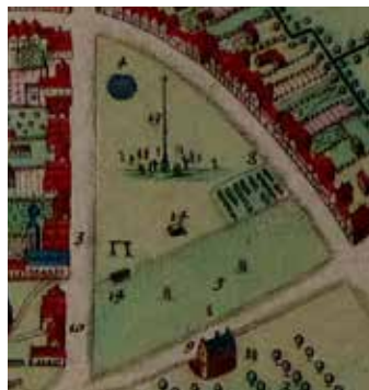
Uittreksel uit de Flandria Illustrata, Sanderus, 1641-1644