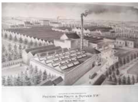
Foto van prent weverij Peeters-Van Haute & Duyver