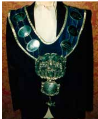
Zilveren breuk Koninklijke Schuttersgilde Sint-Sebastiaan Belsele

Op 30 september 2018 organiseert de Federatie van Vlaamse Historische Schuttersgilden in samenwerking met het stadsbestuur, haar 17de Gildendag in Sint-Niklaas. Tot aan die Gildendag staat er een kleine tentoonstelling in het stadhuis met foto's en voorwerpen die de geschiedenis van de schuttersgilden illustreren, met o.a. een aantal zeer mooie breuken (zilveren kettingen).