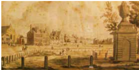
Ets Du Caju 1777

Bij de bouw van het eerste stadhuis in 1841 werd ze verplaatst naar het toenmalige Warandepark, ongeveer waar nu het standbeeld Het Woord staat. De gaeypers op de hoeymerckt werd reeds in 1840 verwijderd.