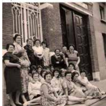
Groepsfoto van het personeel van de breigoed-fabrikant Cockelberg, gevestigd in de Lodewijk de Meesterstraat 30 te Sint-Niklaas